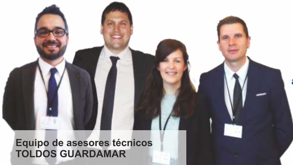
Equipo de asesores técnicos TOLDOS GUARDAMAR

Nuestro equipo técnico le asesorará sobre su nuevo toldo